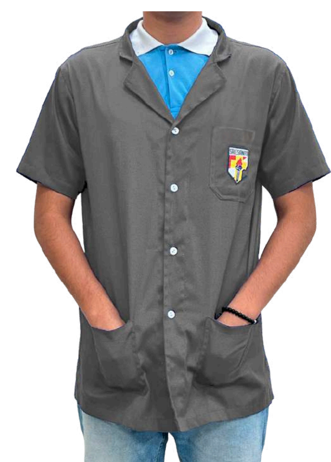
GRIS Diseño Gráfico

En el bolsillo debe ir bordado el nombre del estudiante y arriba la especialidad.